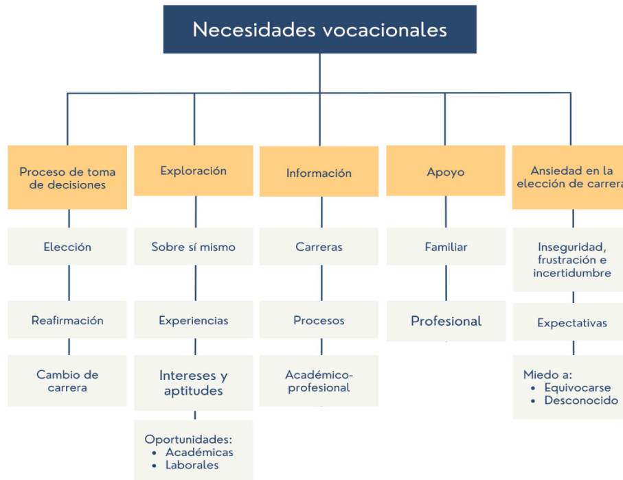
Figura 1 Necesidades vocacionales

Nota. Elaboración propia con base en Chaves-Montero y Rivera-Rojas (2018).